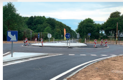
Rond-point de Québitre