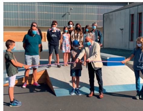
Inauguration du skate-park