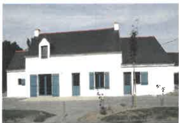
Salle des Berches - Camerun