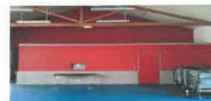
Salle polyvalente (intérieur)